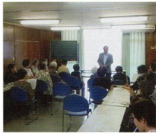
『終活のおはなし』 健康寿命を延ばしましょう (6月)