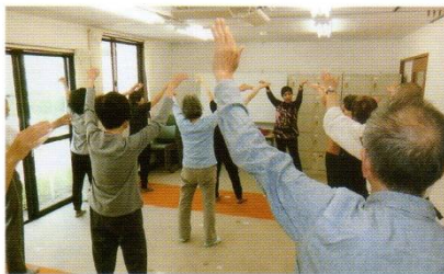
福祉講座のさわやか健康体操

真砂地区の人口 24,689人 (男 11,833人・女 12,856人) 世帯数 11,887世帯 (平成30年5月31日現在) 「ふれあい」発行部数 12,500部