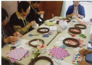
はがれにくいわね～～ (5月)

お花と格闘！終活のおはなし 〔三丁目サロン〕 5月は、じゃばらに折った紙ナプキンの中央をホチキスで止めて1枚ずつ広げれば素敵なお花ができてくれます。なかなかのはがれにくいですよ。」 指先を使って、集中して、皆さんがんばりました。後日、素敵なリースができました。