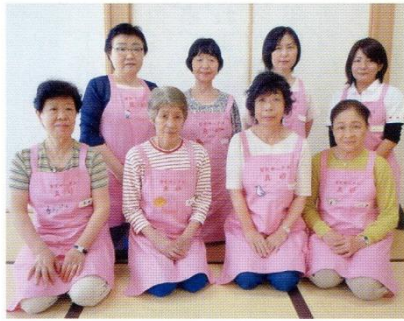
新調したエプロンを身に着けた スタッフの皆さん

「育児サークル」 「あなたの地域の民生委員・主任 児童委員も身近な相談相手です。 お気軽に声をかけてネ……」 毎年5月の育児サークルは保健 師さんと歯科衛生士さんをお招き して、お話や育児相談会と幼児期 の歯の大切さをフリップなどを 使って丁寧に説明していただきま した。 今回も相談コーナーを開設し て、お母さん方の質問に答えてい ただきました。 スタッフの皆さんに数十年ぶり に新調したピンクのエプロンを 使ってもらいました。「エプロン の動物の絵が一枚ごとに違って、 とても素敵ですよ……」 (児童母子福祉委員会)