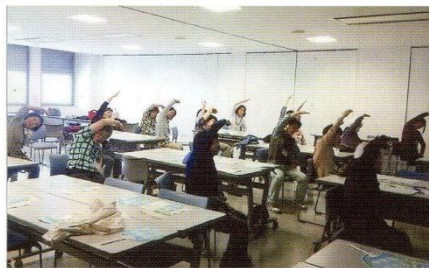
みんなで1・2・3・4。 (5月)

お花と格闘！終活のおはなし 〔三丁目サロン〕 5月は、じゃばらに折った紙ナプキンの中央をホチキスで止めて1枚ずつ広げれば素敵なお花ができてくれます。なかなかのはがれにくいですよ。」 指先を使って、集中して、皆さんがんばりました。後日、素敵なリースができました。