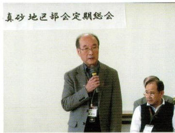
挨拶する成田部会長

29年度事業報告・決算報告、30年度事業計画(案)・予算(案)、新役員などを審議。原案通り承認されました。