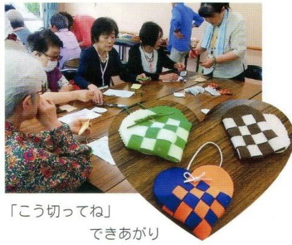
「こう切ってね」 できあがり