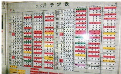
同好会の予定・空室の状況が一目瞭然