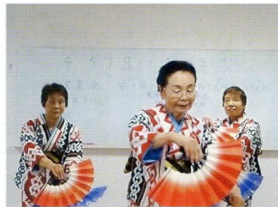
笑楽会の皆さん 毎回楽しみなよ。(4月)

5月は美浜保健センターの方が来られて、ちばしいいきいき体操。生活機能を落とさない、転びにくい身体をめざして、美味しく食べて楽しく話すことを教えてくださいました。