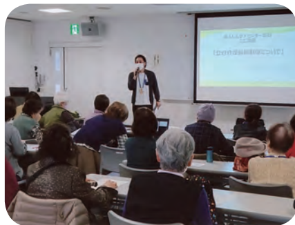
いろいろ聞きたいわね～

1月9日火曜サロンは笑楽会の皆さんによる踊り、1月25日木曜サロンは佃川扇越さんによる大江戸玉すだれで盛り上がりました。それぞれ締めは参加者さんもズンドコ節を踊ったり、玉すだれを体験して楽しい時間を過ごしました。 2月火曜サロンでは、あんしんケアセンターの介護保険制度についてのミニ講座がありました。 何か相談したい時は あんしんケアセンター真砂に 043(278)0111