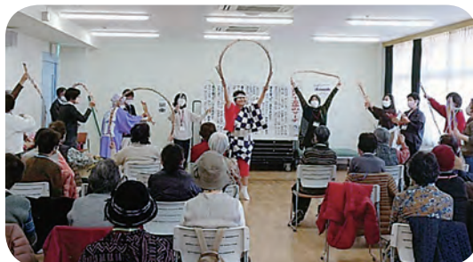
みんなで大江戸玉すだれ 365歩のマーチ