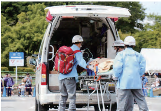
写真上 消火中、下 救急搬送