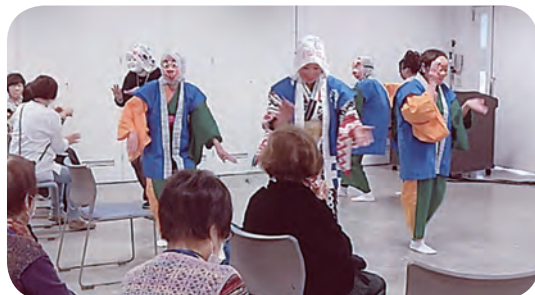
楽しく、パカ面おどり