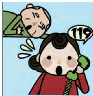
通報→関係組織に連絡→各部署に指示

1と103。これはなんだと思いませんか？題名にヒントがあります。答えは昨年の消防車の出動回数と救急車の出動回数の比率（34件対3492件）です。救急車の出動の