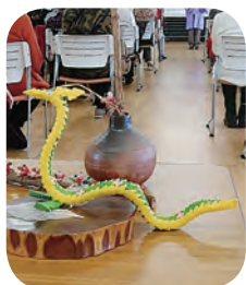
3丁目在住の方の手づくり龍