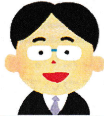
主任ケアマネジャー